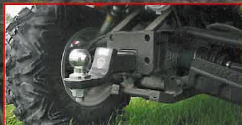
Massiv: Anhängerock mit 2-zölliger Aufnahme