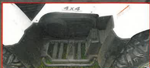
Geräumig: Gute Platzverhältnisse in den Beinkästen. Erhöhte Rasten für den Beifahrer