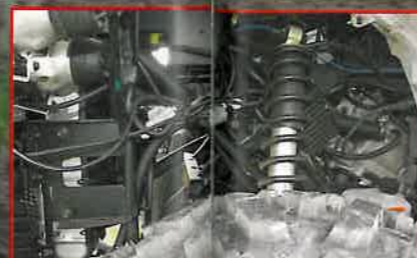
Elektrik: Wilde Kabelführung