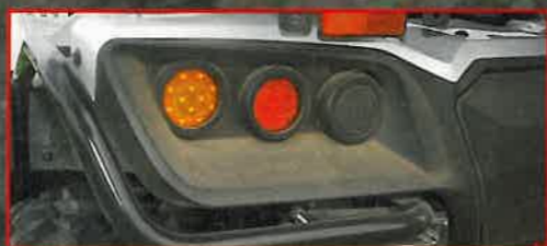
LED: Getrennte Rück und Blinkleuchten