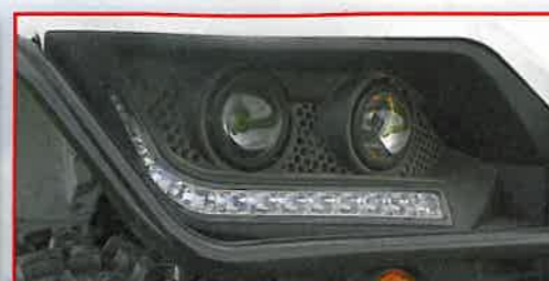
Light-Show: Ellipsoid-Scheinwerfer und LED-Tageslicht