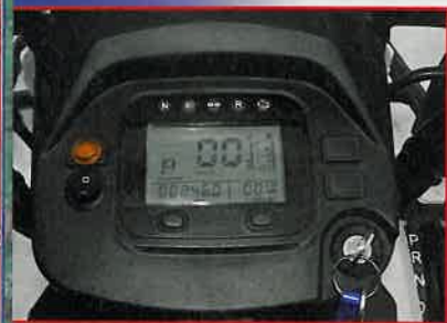
Informativ: Digital-Cockpit mit diversen Anzeigen