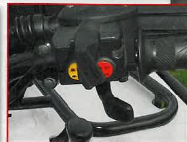
Allrad-Schaltung: Vorderachse wird per Knopfdruck aktiviert