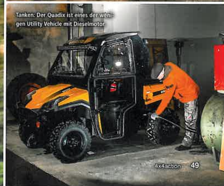
Tanken: Der Quadix ist eines der wenigen Utility Vehicle mit Dieselmotor.