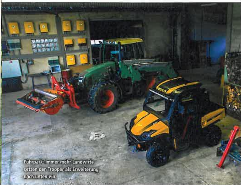
Fuhrpark: Immer mehr Landwirte setzen den Trooper als Erweiterung nach unten ein.