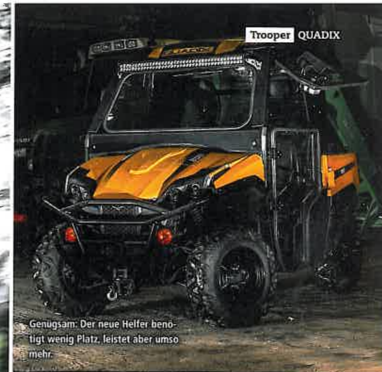
Genügsam: Der neue Helfer benötigt wenig Platz, leistet aber umso mehr.