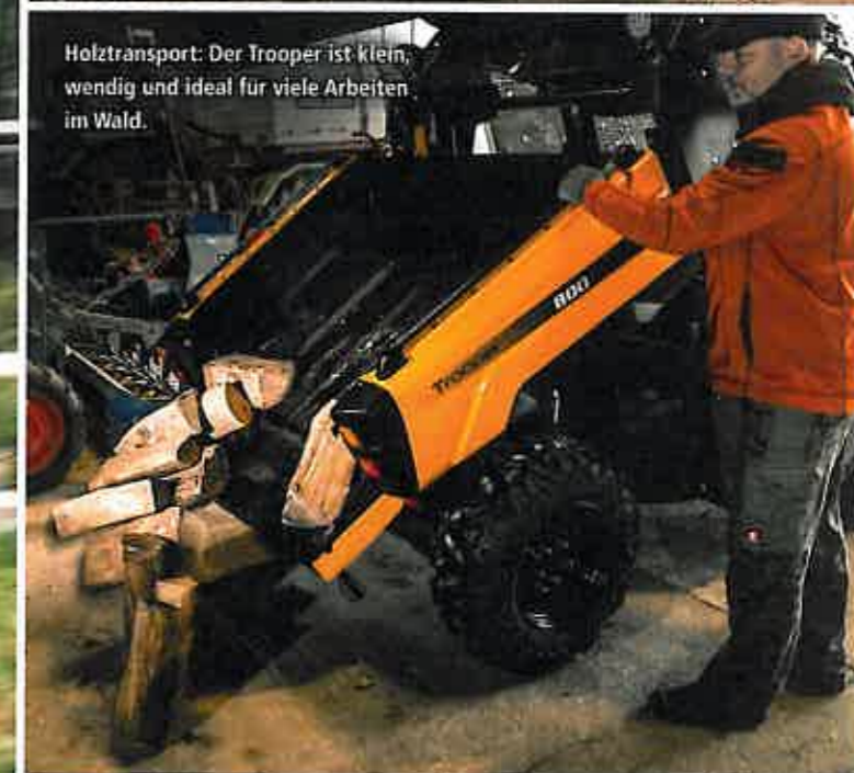
Holztransport: Der Trooper ist klein, wendig und ideal für viele Arbeiten im Wald.